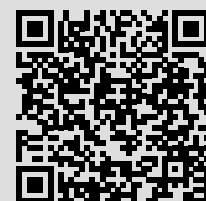
Infos zur Kleinkindbetreuung

unterstützt und gefördert. Erfahren Sie mehr über das Betreuungsteam, den Tagesablauf, die Räumlichkeiten samt Bewegungs- und Spielangeboten, sowie die pädagogischen Schwerpunkte. Leiterin Ute Bayer und ihr Team freuen sich auf Ihren Besuch.