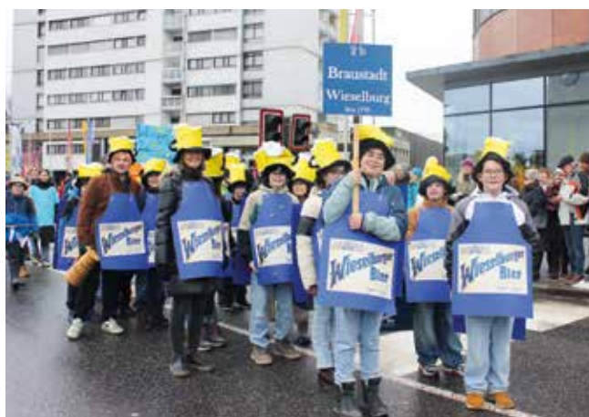
Auch unter den Schülerinnen und Schüler der 2B der Computer-Mittelschule ist Wieselburg als Braustadt bekannt.