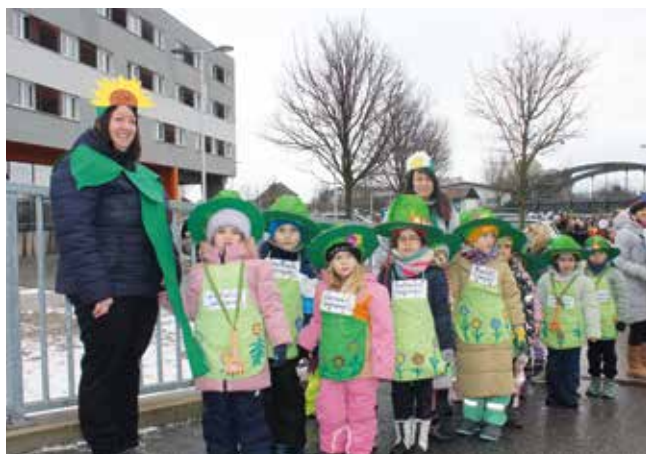
Als „Stadtwaldgärtner der Zukunft“ war der Kindergarten Getreidestraße am Faschingsumzug unterwegs.

len und Genießen ein. Für die passende Stimmung sorgte die musikalische Begleitung, die den bunten Tross schwungvoll durch den Ort führte und das Publikum zum Mitfeiern animierte.