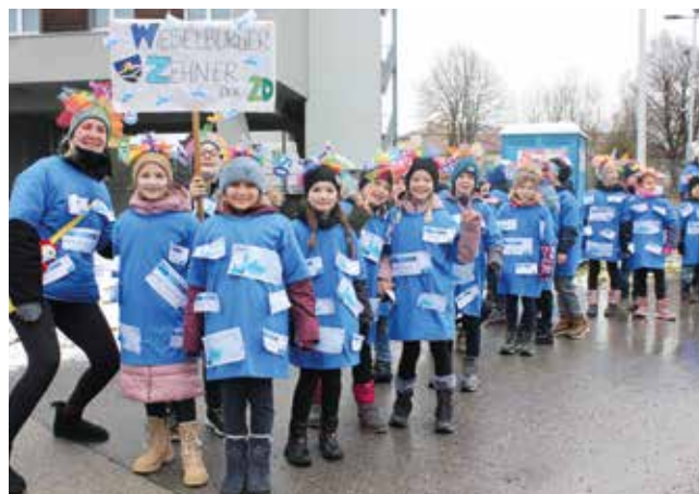
Die zweiten Klassen der Volksschule Wieselburg präsentierten sich als „Wieselburger 10er“ - hier im Bild die 2D.