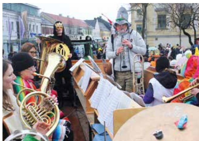
Die Band der Musikschule Wieselburg sorgte für gute Unterhaltung beim Wieselburger Faschingsumzug.