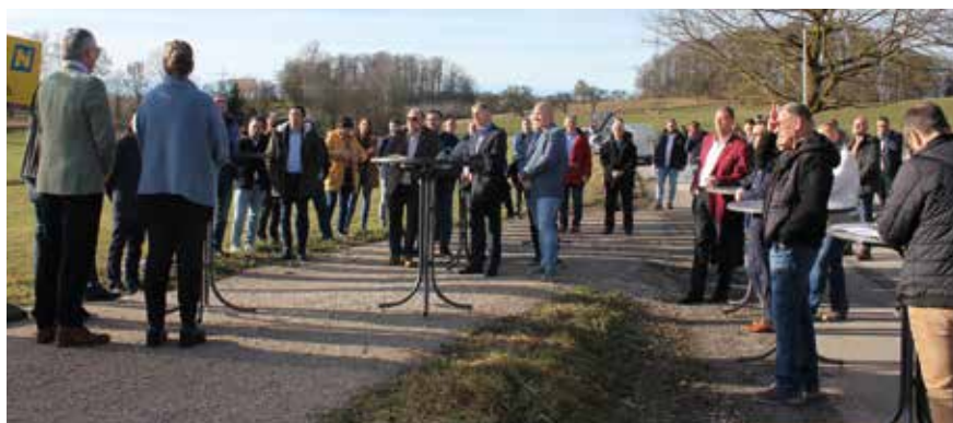
Zahlreiche Gäste wohnten der Eröffnungsfeierlichkeit bei.