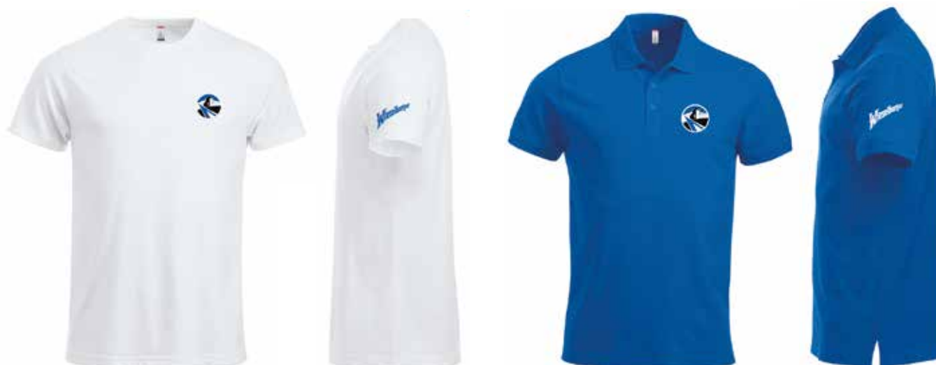
Sowohl die Rundhals-Shirts (links) als auch die Polo-Shirts (rechts) sind in den Farben Weiß und Blau erhältlich.

vor Ort - Geschäftslokal Shirtfactory, Grestner Straße 21